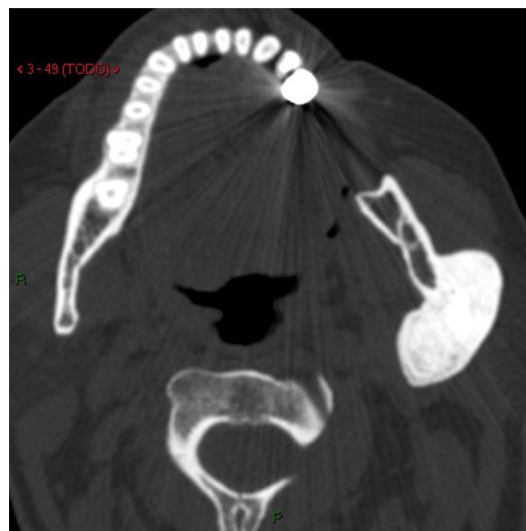
Figura 3 Tomografia computadorizada axial que mostra a lesão estendida para as superfícies interna e externa do ramo ascendente da mandíbula, sem causar reabsorção ou destruição óssea.

O osteoma periférico é uma neoplasia rara da região maxilofacial e envolve mais frequentemente a mandíbula, o côndilo é o sítio preferido. 5 O osteoma solitário