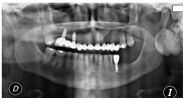
Figura 1 Vista da radiografia panorâmica que mostra uma lesão radiopaca localizada no centro do ramo ascendente da mandíbula esquerda.