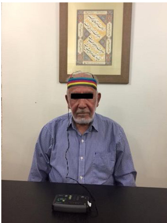
Figura 2 Configuração dos eletrodos de ETCC.

foram diagnosticados com vertigem posicional paroxística benigna (VPPB), 13 com doença de Ménière e 6 com enxaqueca vestibular.