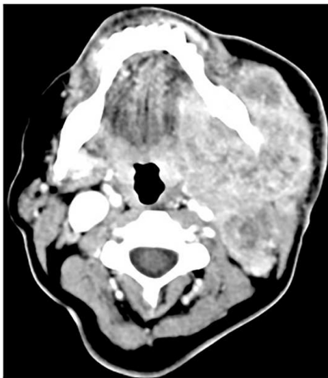
Figura 2 Tomografia computadorizada: tumor de glândula submandibular esquerda localmente avançado.

ramo marginal do nervo facial (fig. 1). A biópsia por punção aspirativa com agulha fina (PAAF) apresentou suspeita de malignidade e a tomografia computadorizada mostrou lesão na topografia da glândula submandibular esquerda, envolvia a mandíbula, sem invasão óssea aparente, e extenso tecido necrótico com infiltração do assoalho da boca (fig. 2). A PET/CT mostrou uma lesão que envolvia a glândula submandibular esquerda (SUV mtox: 17,1) e linfonodos cervicais em nível II, III, V à esquerda e nível IV bilateral (SUV mtox: 10,7). Uma biópsia incisional foi feita sob anestesia local e os cortes histológicos mostraram um carcinoma infiltrativo pouco diferenciado; a análise imuno-histoquímica foi positiva para citoqueratina/CK-6, confirmou a diferenciação epitelial. O diagnóstico de adenocarcinoma de baixo grau foi definido. Enquanto a paciente aguardava o tratamento cirúrgico, ela apresentou sinais de regressão tumoral e o tumor desapareceu completamente após 4 meses. Novos exames